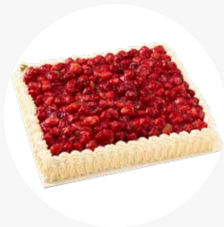
LEVYKAKUT Laktoosittomat. Mansikka 30 heng. 85 € / 50 heng. 110 € Mangomousse 50 heng. 110 € Naked Cake 50 heng. 120 €