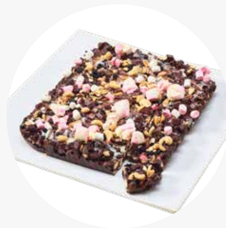
LEVYPIIRAKAT n. 15-20 heng. Porkkanapiirakka (L) 32 € Moccapiirakka (L) 32 € Rocky Road (G, K) 32 € Suklaa-kirsikkapiirakka (M, G) 37 €