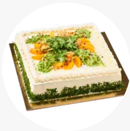
VOILEIPÄKAKUT JA TORTUT Perinteiset ja herkulliset Linkosuon laktoosittomat klassikot. Kinkku 12 heng. 47 € / 25 heng. 75 € Savulohi 12 heng. 50 € / 25 heng. 77 € Poro 12 heng. 50 € / 25 heng. 77 €