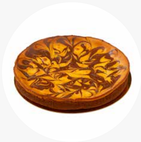
PYÖREÄT PIIRAKAT n. 8-12 heng. Vadelma-juustopiiras (VL, G) 30 € Suklaa-juustopiiras (L) 30 €