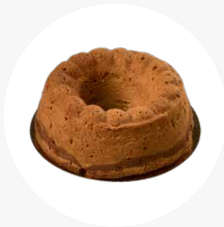
TIIKERIKAKKU Konditorian perinteisesti leivottu laktoositon kahvikakku. 20 € / 700 g