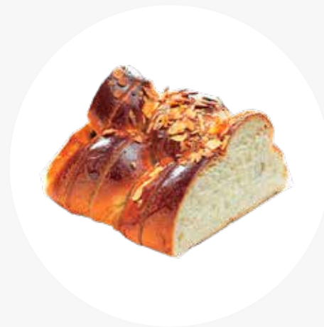
JUHLAPULLAT & PIKKULEIVÄT Pullakranssi (L) 18,00 € Kilopulla (L, K) 4,50 € / 500 g Herrasväen pikkuleivät (L, K) 5,85 € / 100 g Kaneliässä (L) 3,40 € / 100 g